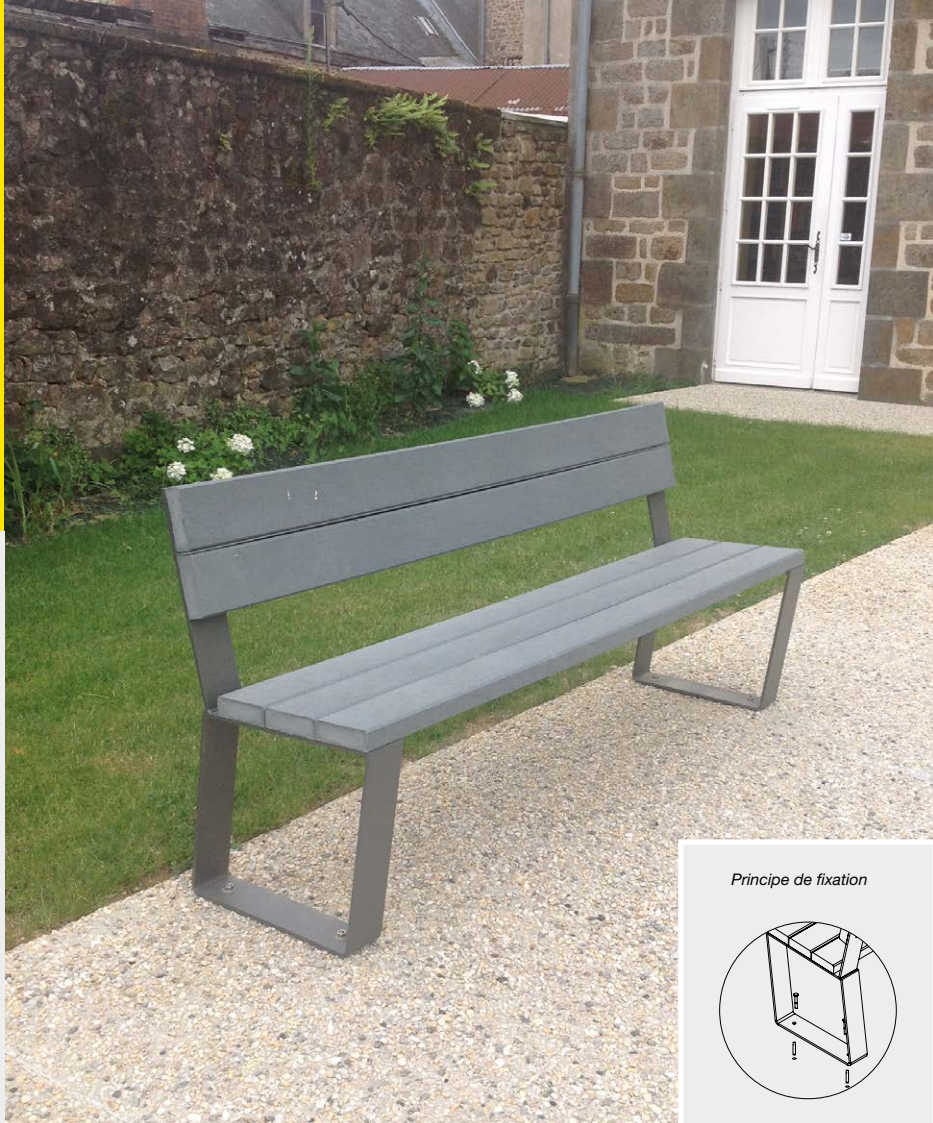
Principe de fixation