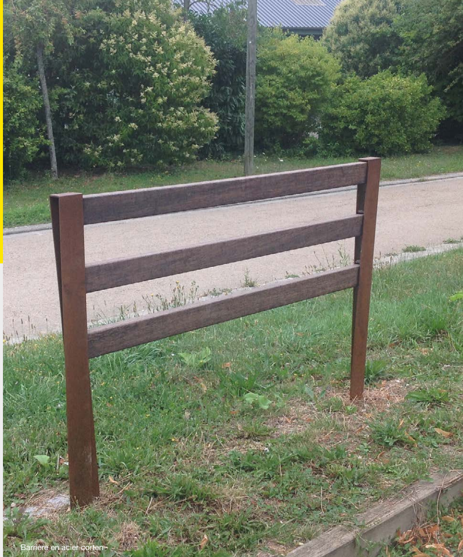
Barrière en acier corten