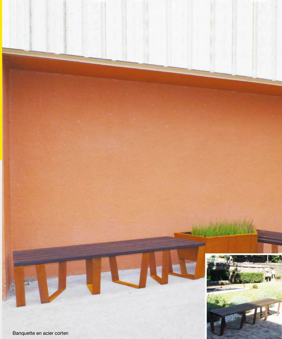
Banquette en acier corten