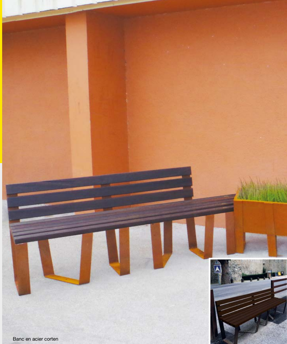
Banc en acier corten

Structure acier corten Banc avec finition droite (exemple ci-contre, sur la photographie de droite)