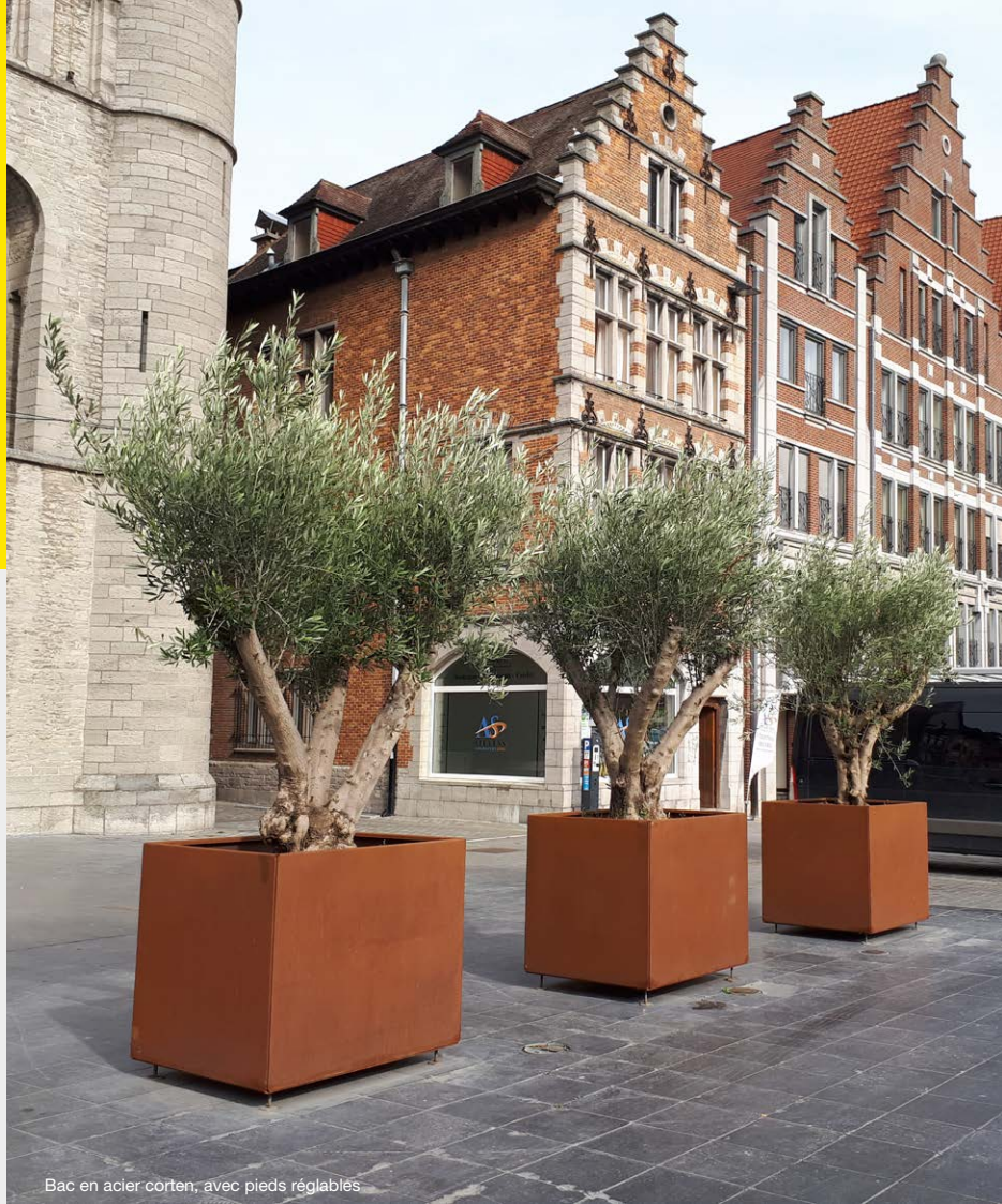
Bac en acier corten, avec pieds réglables