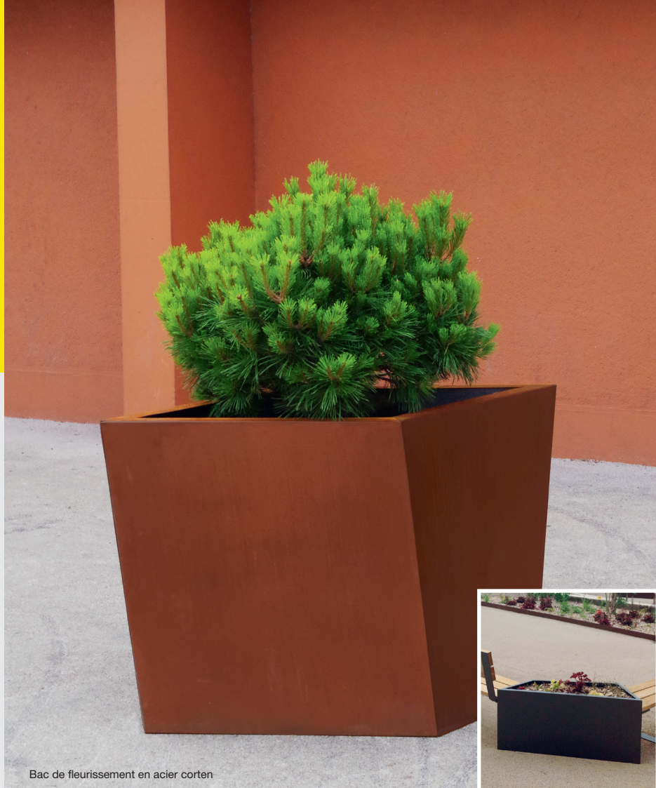
Bac de fleurissement en acier corten