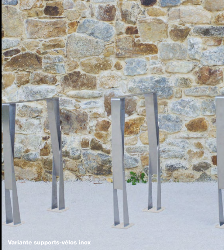
Variante supports-vélos inox